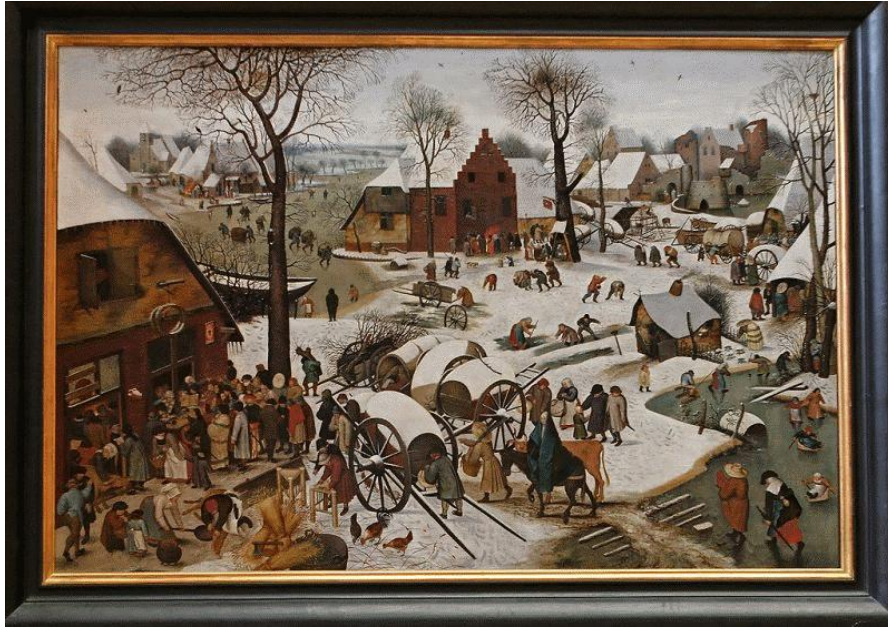
Le paiement de la dîme (Pieter BRUEGHEL le jeune)